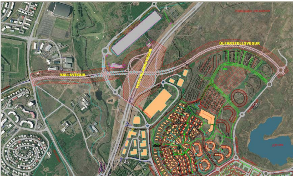
Yfirlit um framkvæmdasvæði (rauð skástrikað)

Korpa (Úlfarsá) rennur þvert á stefnu veglínu Hallsvegjar til norðurs og mun því þurfa að brúa hana. Suður af þeirri brú er stífla í ánni og af þeim völdum lón í árfarveginum. Milli Korpu og Vesturlandsvegjar eru óbyggðir melar þar sem þrífst nokkuð kjarr og lúpína.