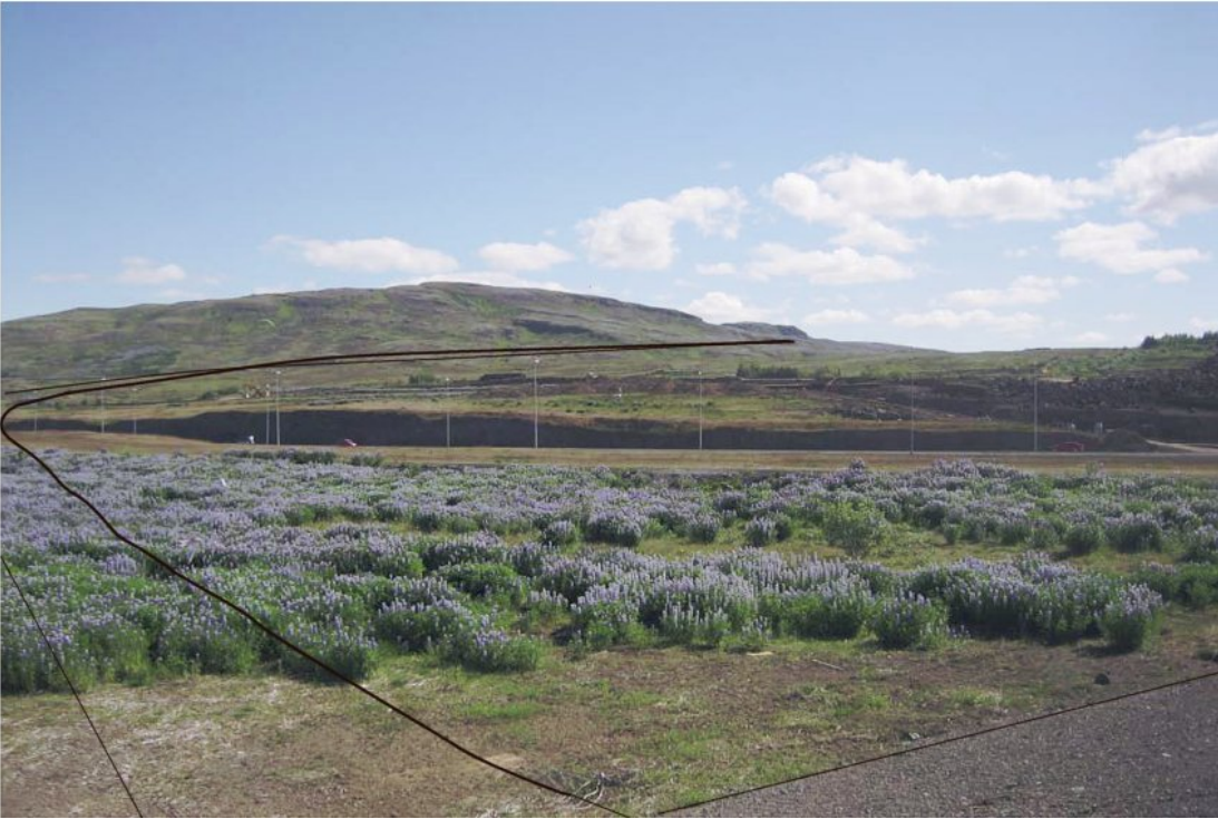
Mynd 2 Fyrirhuguð lega vegar um hlíðar Úlfarsfells. Horft að Vesturlandsvegi frá eystri bakka Korpu. Nákvæm lega óviss.