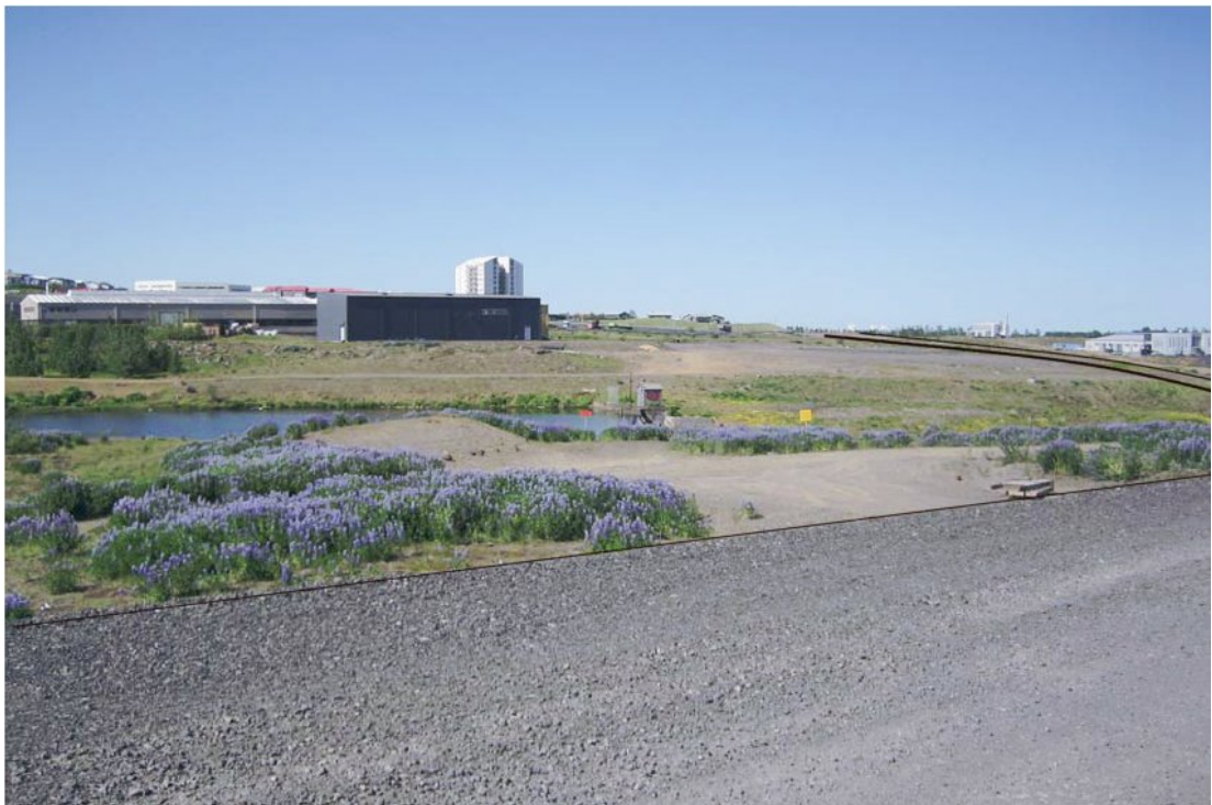
Mynd 1 Horft yfir fyrirhugað vegstæði frá Vesturlandsvegi til vesturs að gatnamótum Víkurvegjar og Hallsvegjar. Nákvæm lega óviss.

Umferð um Vesturlandsveg fer um framkvæmdasvæði meðan mismög gatnamót verða reist.